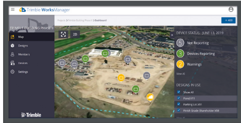
Tabloul de bord intuitiv vă arată dispozitivele digitale și informațiile legate de proiect